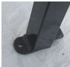
Skrivas enkelt fast vid behov.