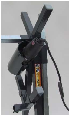
Vikt 13 kg!

Byt plats på profilrör Ax2 och B och du har fällt ihop eller fällt ut arbetsbocken BRUSE. I röret (C) har du ditt verktyg lättillgängligt. D- placera rörstödet i fäste vid förvaring/transport.