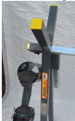
Vid arbeten med vänster hand vändes gaveln med verktygsröret.

Tips! Bild 1: använd bara den ena balk A så tar den mindre plats, L= 855 mm. Sätt ihop balkarna A, L= 1610 mm.